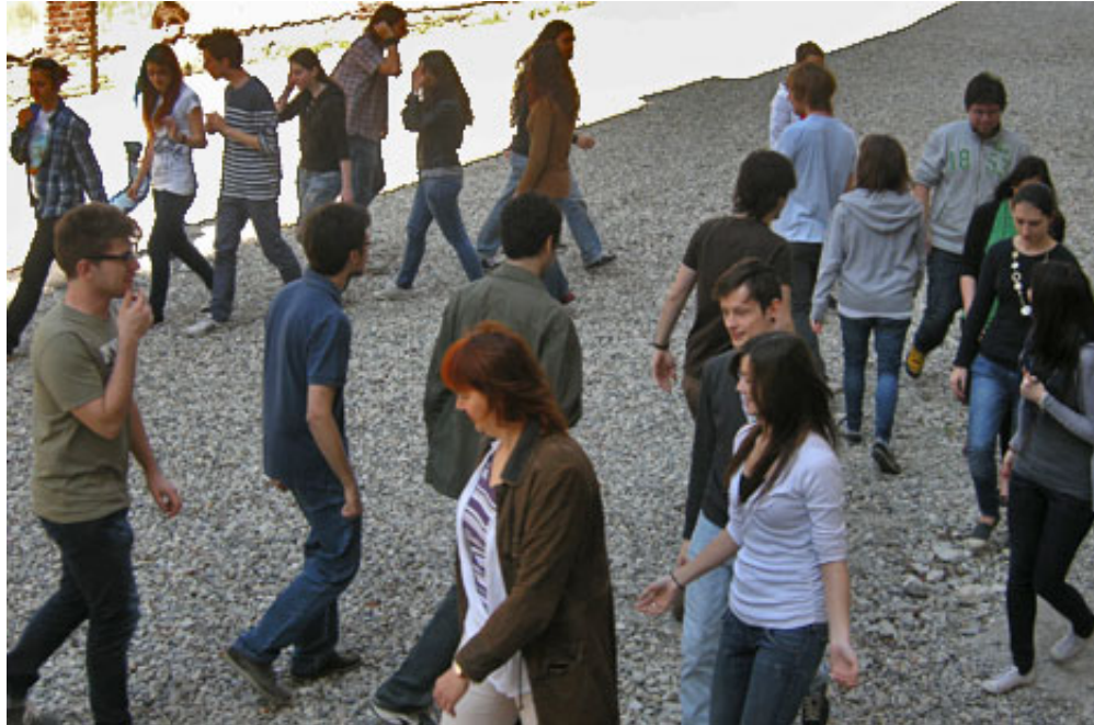
"Chocka i gång talet-övning" med svenskstudenter i Milano.